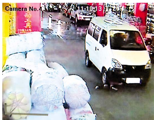
最初の車は、ロールオーバ