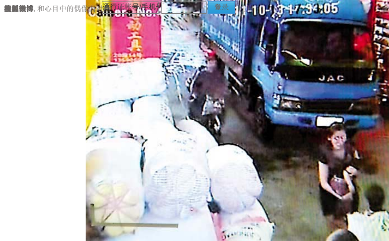
病院に向かって子を保持している母親