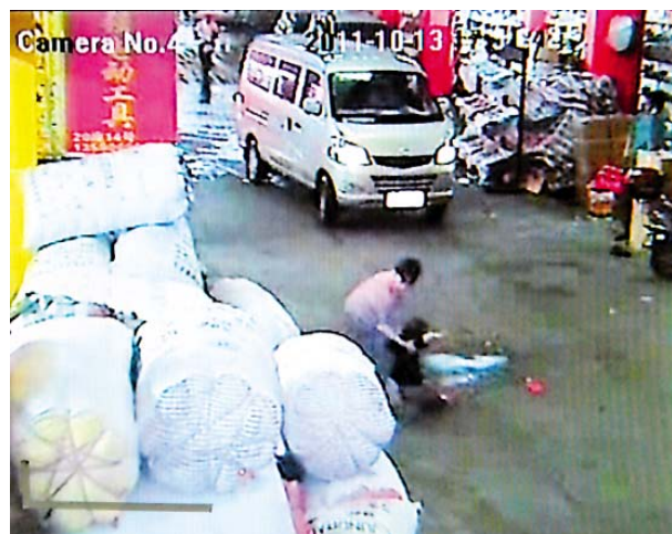
ごみを拾う叔母は小さな越越をピックアップ