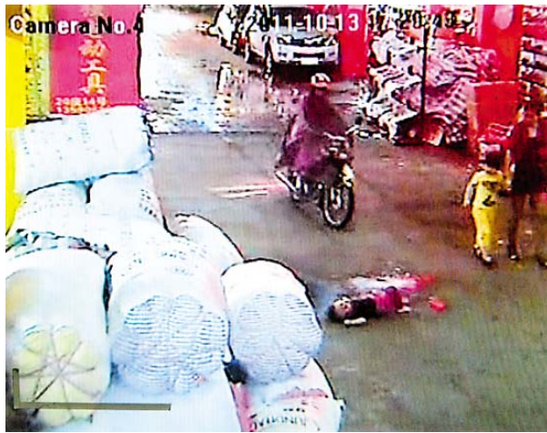
八人：黄色の後で少女と中年の女性が、視線は停止していない