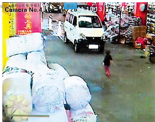
道を歩いて少し越越