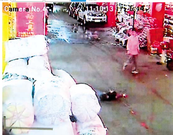
第三：明るい色の長袖の服、男性、監視の範囲内とは、小さな越越を見つめ、しかし遠ざかって子供から行くされています