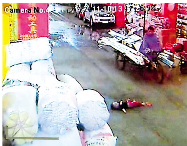
5人目：三輪車を踏んで後にブルーマン