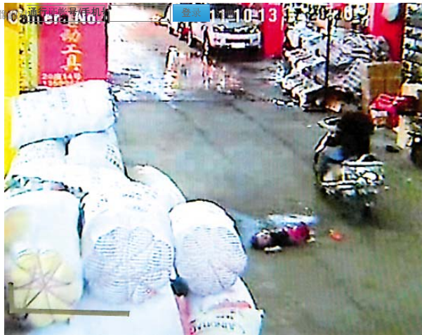
七人：黒の男バイクを通じては、常に小さな越越に振り返る