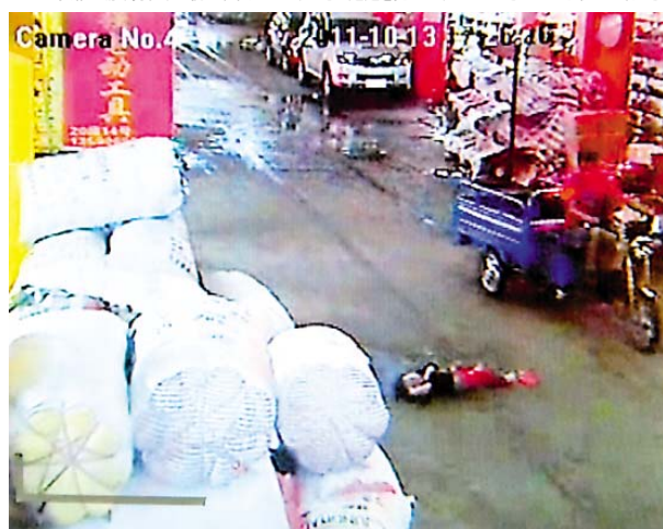
四人：ドアを通して店からの横三輪車青男性、後のトランクオープンは二回、小越越から2mに見て見ぬふりをする。小越越を見て、再び赤の男を過ぎて運転した後、停止していない